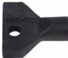
trojhranný klíč pro odblokování