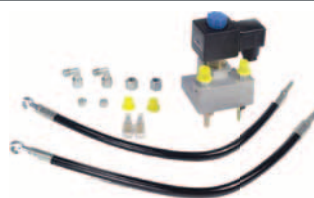
antipanikové zařízení* umožňuje pohyb ráhna v případě výpadku elektrické energie