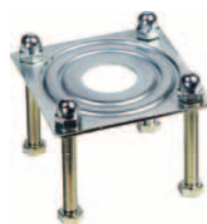
deska pro vidličkovou podporu