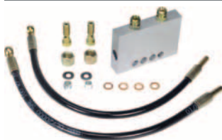
protivandalová ochrana hydrogregátu* ochraňuje hydraulický systém, pokud je vyvíjen tlak na ráhno