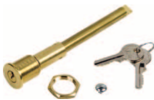
uvolňovací zámek s číselným klíčem od 1 do 36